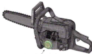
Motorsäge mit aufgeklebter Forstlibelle

Achtung: Durch Anbringung der Forstlibelle dürfen keine sicherheitsrelevante Einrichtungen der Motorsäge beeinträchtigt werden. Weiterhin ist auf alle Sicherheitsvorschriften des Herstellers der Motorsäge zu achten.